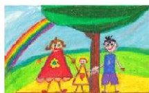
Specjalny Ośrodek Szkolno-Wychowawczy nr 1 w Suwałkach